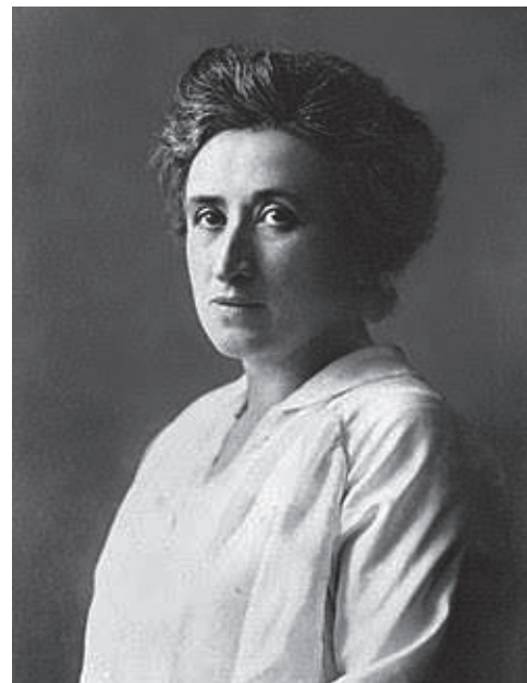
Rosa Luxemburg, 1871-1918, Comunista alemana que fundó la Liga espartaquista y que sería asesinada en enero de 1919.

Estas demandas no están alejadas o fuera de la lucha proletaria. No es tarea únicamente de