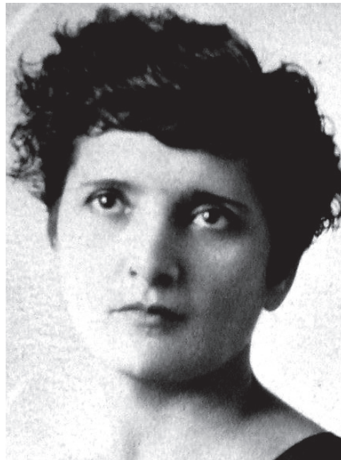
Elvia Carrillo Puerto (1878-1968). Sufragista mexicana, miembro del Partido Socialista del Sureste. Defensora del voto femenino.

Frente a esto, el gobierno de Morena, siguiendo el patrón del anterior gobierno perredista, ha desplegado todo el aparato represivo: policía municipal, estatal, Guardia Nacional; para reprimir a los compañeros como sucedió el 31 de enero cuando lanzaron piedras, cohetes y golpearon a los maestros de educación indígena, quienes protestaban por la imposición del gobernador de quien los representaría en su sector. Todo con el objetivo de evitar el cierre de las vías del tren y garantizar así el paso de los trenes de la empresa Kansas City Southern, así pues tenemos a la Guardia Nacional protegiendo los intereses de las empresas beneficiadas por los neoliberales. Otro ejemplo es la última detención arbitraria masiva, contra 24 comuneros de Zirahuén y estudiantes de la Normal Rural Vasco de Quiroga “Tiripetío”, quienes retiraron la racista estatua de “Los constructores” en Morelia la cual mostraba a un español conquistador sojuzgando a dos indígenas.