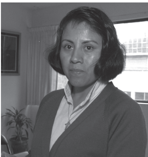
Digna Ochoa y Plácido (1964–2001) defensora de los derechos humanos ejecutada de manera extrajudicial

¡Luchemos por la tierra, el medio ambiente y el socialismo!