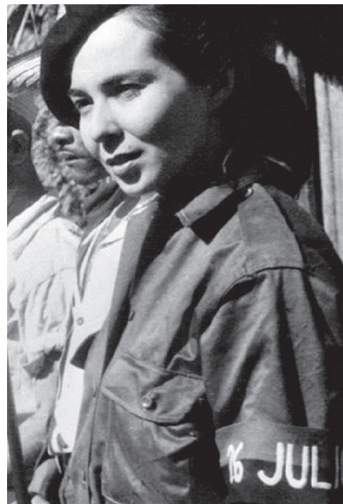
Vilma Espin Guillois (1930-2007). Cubana e Ingeniera química. Luchadora contra la dictadura Batista.

del campo y la ciudad hagamos las leyes, cuando las instituciones corruptas y sus personajes racistas, elitistas y corruptos desaparezcan y nunca más vuelvan a existir. Sabemos que el camino aún es largo y se requiere de la participación de todo el pueblo trabajador y consciente de la realidad que quiera un verdadero cambio, únete con nosotros y abraza la lucha por el socialismo, sólo así lograremos la verdadera democracia popular. ■