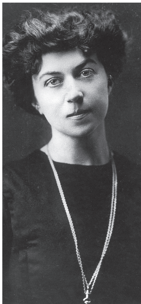
Aleksandra Kollontái (1872-1952) Escritora, marxista y feminista rusa. Comisaria de Bienestar social. Fundadora del Zhenotdel: departamento de las mujeres trabajadoras y campesinas.

Para nosotros, esa lucha no representa únicamente dos polos: conservadores y liberales, sino representa la lucha de clases. Esa lucha de clases sociales es parte de las contradicciones en el sistema capitalista que se expresa en este momento entre la burguesía reaccionaria, que no quiere perder ni tantito de lo que han robado durante el neoliberalismo, y la pequeña burguesía liberal hecha gobierno que, aliada con algunos grandes burgueses monopolistas, hoy buscan conciliar los intereses antagónicos de las clases que conforman la sociedad mexicana.