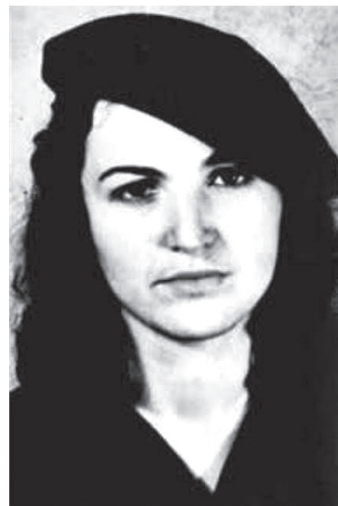
Támara Bunke (1937-1967). Conocida como Tania la guerrillera, acompañó al Che a su viaje a Bolivia y ahí caería en combate.