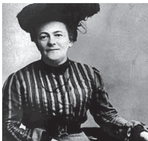
Clara Zetkin, 1857-1933, marxista alemana fundadora de la liga espartaquista, luchadora de los derechos de la mujer y el socialismo.

CADA 8 DE MARZO desde 1911 conmemoramos el Día Internacional de la Mujer Trabajadora. Lo que pocos saben es que las promotoras de esta iniciativa fueron mujeres y hombres que luchaban por el socialismo. Esta fecha se propuso en la Segunda Conferencia Internacional de Mujeres Socialistas, Copenhague (Dinamarca) en agosto de 1910 por la alemana socialista Clara Zetkin.