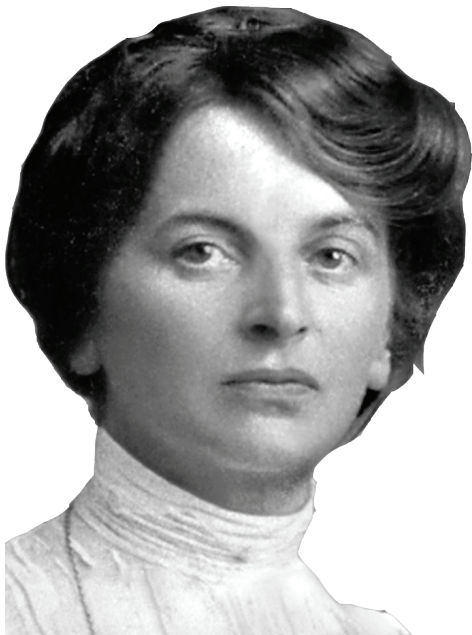
Inessa Armand (1874-1920). Escritora y revolucionaria francesa. Presidenta del Consejo Económico de Moscú y miembro del Comité Ejecutivo de los Soviets.

La Secretaría del Trabajo y Previsión Social (STPS) es una caricatura, es ineficaz, es un elefante echado si de proteger al trabajador