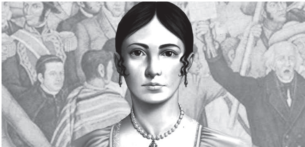
Leona Vicario (1789-1842). Importante mujer en la Independencia Mexicana, fungiendo como informante de los insurgentes

Aquí como que algo no cuadra y parece que el pueblo mexicano terminó como las gallinas... pero esto no es todo, además fue de